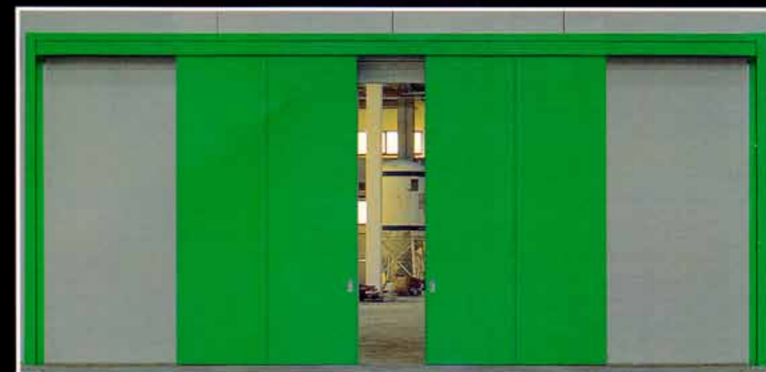
Portone scorrevole REI 120 a due partite