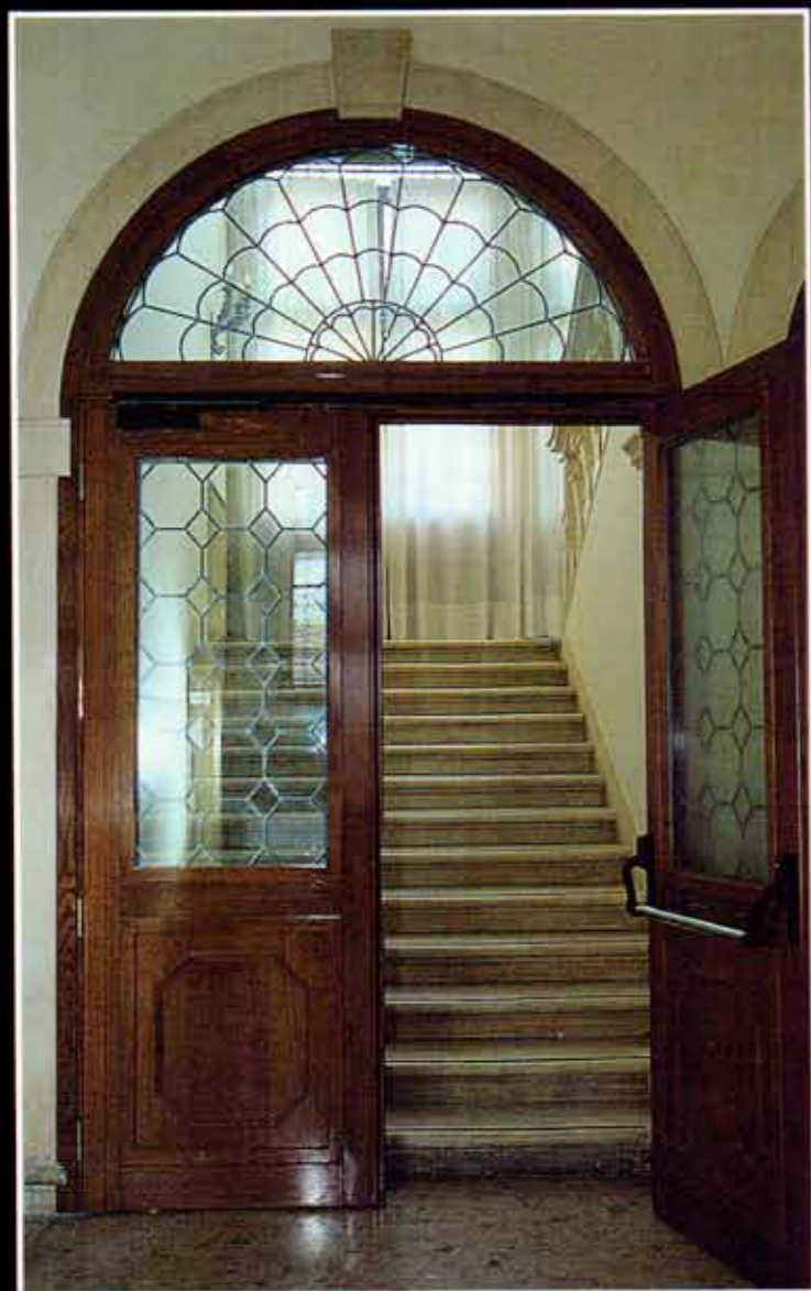
Porta vetrata REI 60