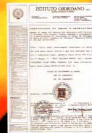
Certificati di prova ottenuti presso gli Istituti autorizzati.