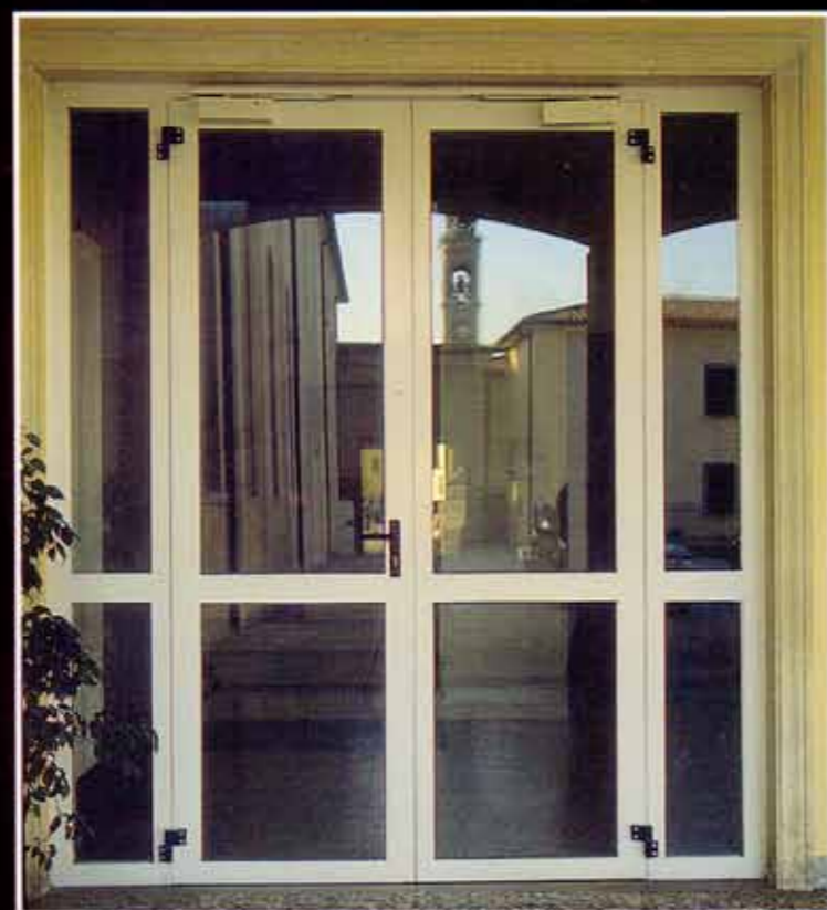
Porta vetrata REI 60 a due ante con fianchetti fissi