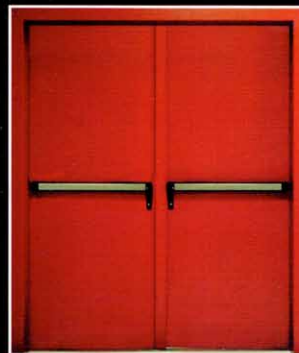
Porta cieca REI 60/120 a due ante