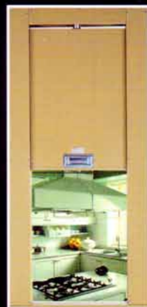
SCORREVOLE VERTICALE A SALISCENDI REI 120

CERTIFICATI DI PROVA ED OMOLOGAZIONI CONFORMI ALLA NORMA UNI 9723