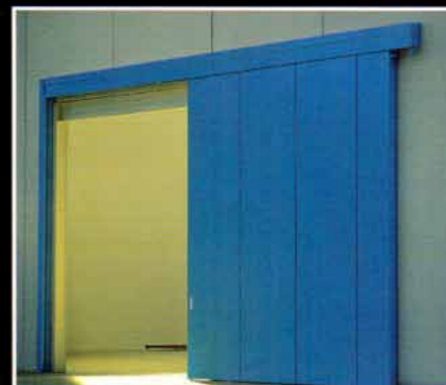
Portone scorrevole REI 120 ad una partita