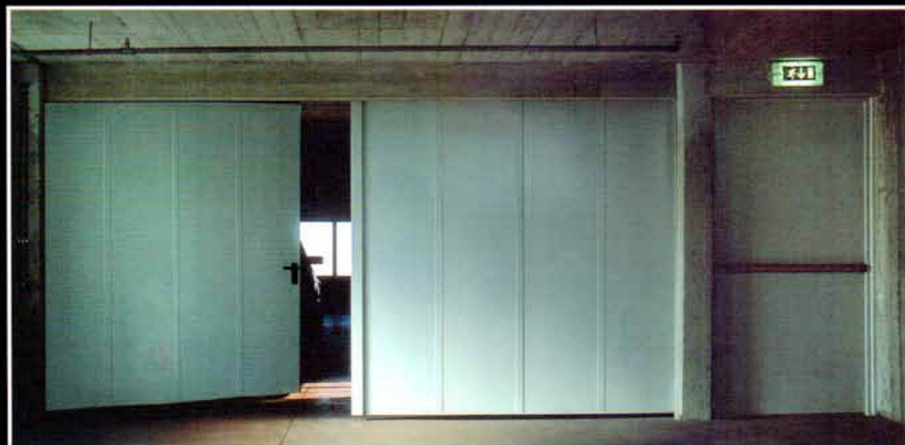
Portoni "MEGA" REI 120 ad una o due ante di grandi dimensioni