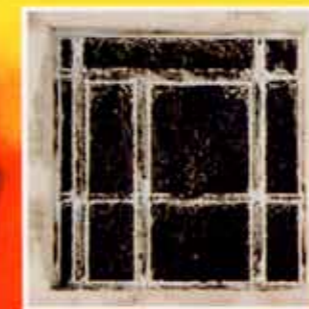
Lato esposto al fuoco dopo la prova.