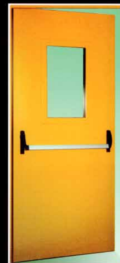
Porta REI 60/120 ad una anta con oblò vetrato