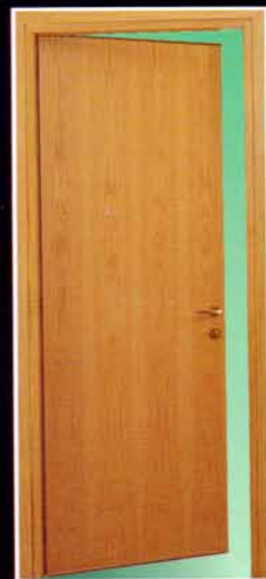
Porte cieche REI 30-60 ad uno o due battenti