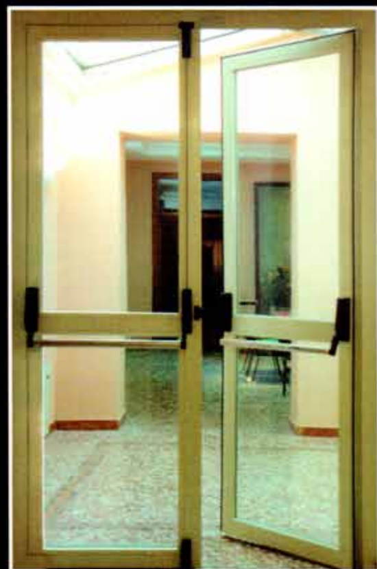
Porta vetrata REI 60 a due ante