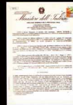
Omologazioni rilasciate dal Ministero dell'Interno - Direzione Generale della Protezione Civile

Le denominazioni RI - RE - REI determinano l'attitudine di un elemento a conservare per un tempo prestabilito: